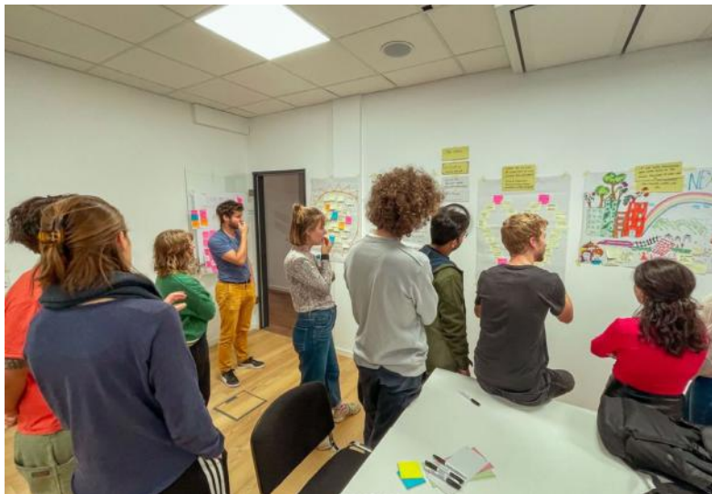
Teilnehmende stellen Projekte vor oben 1

Am Anfang des Novembers fand unser Greencademy Trainings Kurs statt, bei dem Menschen aufeinandertrafen, die sich in der Arbeit mit Jugendlichen engagieren und Nachhaltigkeitsthemen besser in ihrer täglichen Arbeit vermitteln wollen. Dieser Trainingskurs war ein weiterer wichtiger Schritt zur Schaffung eines internationalen Netzwerks von Akteuren die jungen Initiativen dabei unterstützen ihre Projekte im Bereich nachhaltiger Agrarwirtschaft und Lebensmittelproduktion zu realisieren.