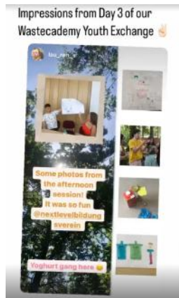
Instagram Post eines Teilnehmenden oben 1

Wie im letzten Jahr war dieser zehntägige Jugendaustausch ein Austausch, der sich mit unserem Überkonsum und den Auswirkungen beschäftigte. Die Jugendlichen lernten, wie sie ihren Müll reduzieren können und welche Methoden es gibt, um diesen zu recyceln und wiederzuverwenden. Zudem war es auch eine kulturell bereichernde Erfahrung.