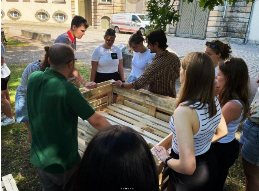
Arbeiten an den Hochbeeten oben 1

Beim Projekt „grünes Klassenzimmer“ haben wir im Juni an der Marie-Elise Kayser Schule den Schulhof weitergestaltet. Dabei konnten wir zwei Hochbeete aus alten Paletten bauen und farblich gestalten. So haben die Schüler und Schülerinnen Inhalte zu den Themen Upcycling, Nachhaltigkeit und Sicherheitsmaßnahmen auf öffentlichen Plätzen vermittelt gekriegt.