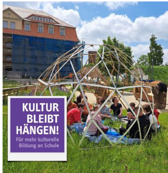
Endergebnis der Projektwoche: Geodome oben 1

Als Kulturpartner haben wir das Projekt „Innehalten und Kraft schöpfen“ mit der Christophorusschule Erfurt geführt. Eine Woche lang bauten die Schüler*innen an einem Geodome auf dem Petersberg und waren begeistert von der Erfahrung, an der frischen Luft an einem Projekt zu arbeiten, welches die Gemeinschaft und den Zusammenhalt stärkt.