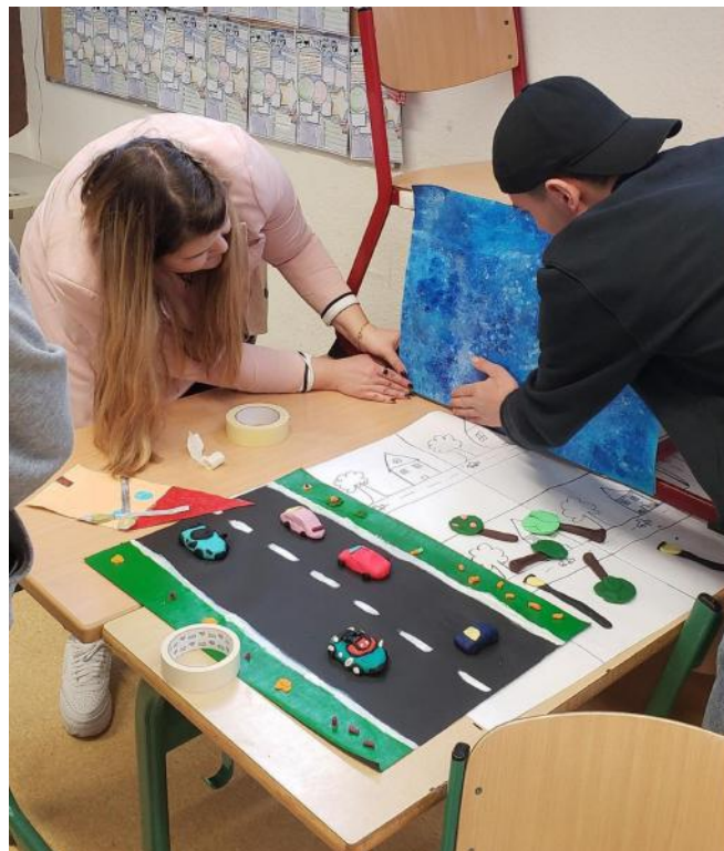
Prozess Videoproduktion und Animation

Durch die Projekte konnten die Lernenden nicht nur ihre kreativen Fähigkeiten verbessern, sondern auch viel über Nachhaltigkeit und Umweltschutz lernen.