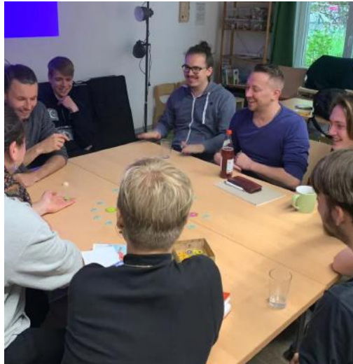
Bild vom Workshop oben 1

Im Rahmen des Projektes “Create to Educate” fand ein kostenloser Workshop zum Entwickeln von nachhaltigen Spielen statt. In lockerer Atmosphäre gab es neben Spieltheorie vor allem viele spannende Praxiserfahrungen zu machen.