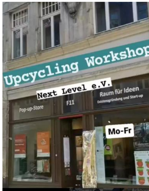
Instagram Post vom Pop up Store

Im Juni hatten wir die Möglichkeit das Thüringer Ministerium für Umwelt, Energie und Naturschutz auf den 18. Thüringentagen in Schmalkalden zu unterstützen. Während den drei Tagen konnten Entdecker*innen Sukkulente in Einmachgläser pflanzen sowie weiße Papphocker verzieren, die als Erinnerungsstücke mit nach Hause genommen werden konnten.