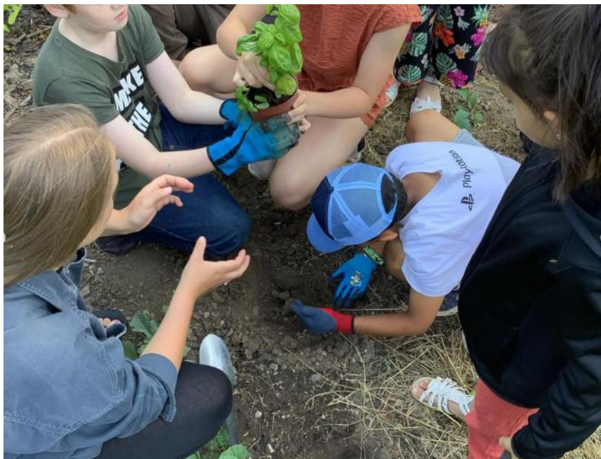
Schüler*innen beim Pflanzen im Gemeinschaftsgarten oben 1

Das „Gemeinschaftsgarten-Projekt für eine nachhaltige Zukunft“, haben wir mit der Gemeinschaftsschule Otto-Lilienthal am 3.Juli 2023 verwirklicht. Wir haben im Rahmen eines Cleanup-Projekts die Umgebung von Müll befreit. Im Gemeinschaftsgarten an der Geraaue haben die Kinder Pflanzungen durchgeführt und Unterschlüpfе für Tiere gebaut.