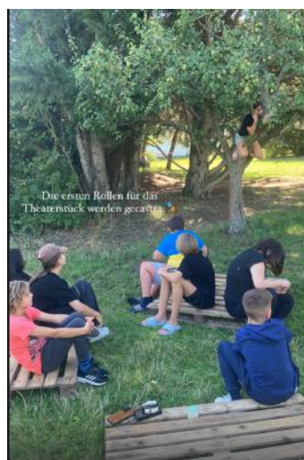
Instagram Post von einer Gruppe oben 1

Bei der Dramacademy wurden Kinder und Jugendliche bis 16 Jahre durchmisch. Die kleineren bekamen einen „Buddy“, mit dem sie Zeit verbringen und bei Fragen sich an diesen wenden konnten. Dabei wurden auch Kinder aus der Ukraine miteinbezogen. Um die Gemeinschaft zu stärken, wurden Kooperationsspiele gespielt sowie mit Hilfe eines Besuchs einer Schauspielerin selbst ausgedachte Theaterstücke erprobt und aufgeführt. Ebenso durfte ein Abstecher in den Thüringer Wald zum Klettern im Kletterpark in Hohenfelden nicht fehlen. Förderung durch „Kultur macht stark“.