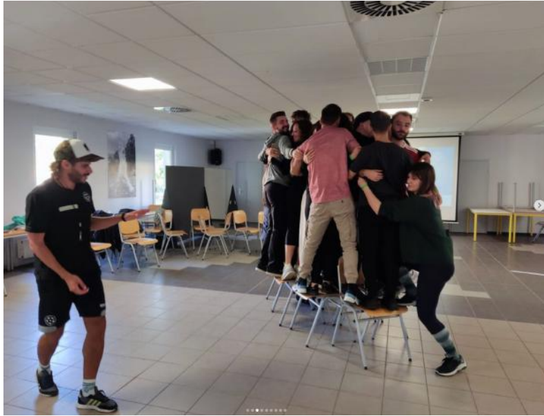
Spiel zur Stärkung des Gemeinschaftsgefühls oben 1