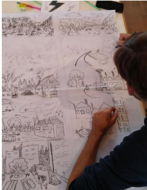
Gestaltung an eigenem Nature Comics oben 1

von Comics und Jugendarbeit einen langfristigen, positiven Einfluss auf die Jugendliche und ihre Umgebung hat. Nicht nur eine intensive Auseinandersetzung mit dem Einsatz von Comics, sondern auch ein bedeutender Schritt zur Schaffung eines internationalen Netzwerks war hier das Augenmerk. Dieses Netzwerk engagiert sich dafür, aufstrebende Initiativen junger Menschen zu unterstützen, die ihr Vorhaben im Bereich nachhaltiger Projekte verwirklichen möchte.