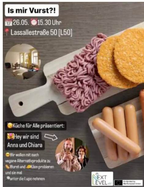
Instagram Post für den Workshop oben 1

Auch unser Projekt “KüFA- Küche für alle“ haben wir fortgeführt, indem wir weitere Kochabende gestaltet haben. Dafür haben wir vegetarische wie auch vegane Gerichte zur Verfügung gestellt. Außerdem gab es den Vegan Workshop „Is mir Vurst?!“ geführt von zwei Mädels, die dabei vegane Alternativprodukte zu Wurst und Käse zeigten, zum Probieren einluden und auch auf die Inhaltsstoffe aufmerksam machten.